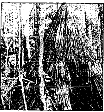
METSAVENNAD ehitasid endale metsadesse kõige leidlikumaid eluasemeid

Ühe naise koputaja tõttu avastanud Organid tookord ta peidupaiga. Ta elu „kurat“ kandis seeliku, tegutsedes julgeoleku meeste palgalise nuhina, olles samaaegselt ka ühe miilitsa armukeseks. Ettekavatsetult ja kõige räpasematel kaalutlustel saatis see inimene ta vaseshahti, külmale maale.